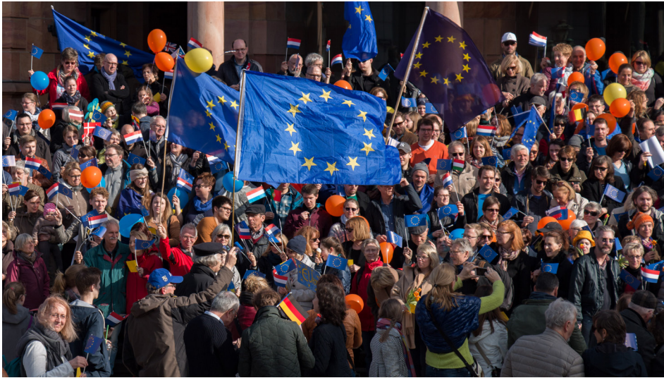
A demonstration of the Pulse of Europe movement in Wiesbaden, Germany.