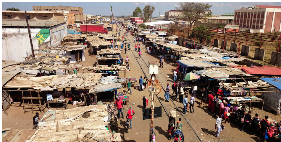
Markt in Lusaka.

Die Arbeit und das Leben hier in Sambia gefallen mir insgesamt sehr gut und ich wurde in meiner Gewissheit, langfristig im Berufsfeld der Internationalen Zusammenarbeit tätig sein zu wollen, bestärkt. Die Entwicklungszusammenarbeit wird zunehmend kritisch diskutiert und auch ich frage mich manchmal, ob meine Arbeit wirksam, nachhaltig und sinnvoll ist. Gerade in unseren durchgeführten Computerkursen für die Lehrpersonen zeigte sich jedoch schön, was wir, das heisst meine Arbeitskollegin, welche die Kurse mit mir leitet, und ich, mit unserer Arbeit erreichen konnten. So hatte die Mehrheit der 45 Lehrpersonen bis anhin grosse Mühe, am Computer selbstständig