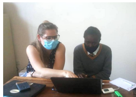
Computertraining für eine Sekundarschülerin, Foto: Chance4all.

COVID-19 ist natürlich auch hier omnipräsent, und so waren die Schulen im letzten Jahr für sechs Monate geschlossen. Nach leicht verlängerten Weihnachtsferien sind sie seit dem 1. Februar wieder geöffnet und ich kann 2-3 Tage im Home-Office und den Rest vor Ort im Projekt arbeiten, wobei ich für diese Abwechslung sehr dankbar bin. Den Alltag der Sambier auch wirklich mitzuerleben, das heisst beispielsweise Minibus zu fahren, die Menschen bei sich zu Hause oder einen Gottesdienst zu besuchen, dies alles fällt wegen Corona leider aktuell aus. Nichtsdestotrotz durfte ich schöne Freundschaften schliessen und ich empfinde die Sambier ganz generell als ein sehr herzliches Volk. So freue ich mich darauf, was die letzten vier Monate meines Einsatzes noch bringen werden und ich stehe bei Fragen zu Comundo oder zu meiner Arbeit